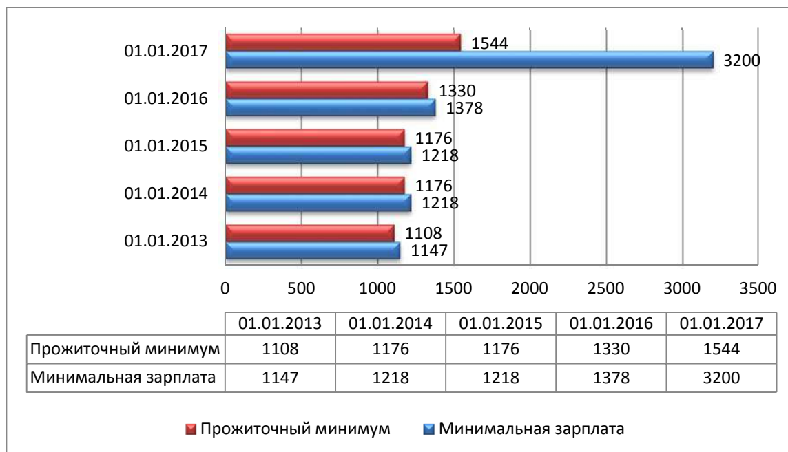
Рис. 3. Уровень прожиточного минимума и минимальная заработная плата за 2010–2017 гг. грн.

С 01.01.2017 г. прожиточный минимум составляет около 58 долларов, а минимальная заработная плата – около 118 долларов. По классификации ООН, если доход человека в месяц менее 150 долларов – то он живет за черной бедности. По этой же классификации более 83 % населения Украины испытывает трудности в связи с ухудшением благосостояния [2].