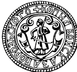
Рис. 2 – Печатка Війська Запорозького [1]

На військовій печатці Запоріжжя було зображення козака з мушкетом і шаблею. Надалі цей «Герб Силного Войска Запорозького» з деякими змінами був зображений на усіх печатках запорожців. Щодо походження зображення козака з мушкетом, який вважається гербом Війська Запорізького, слід підкреслити, що протягом 1767–1755 років воно використовувалося на документах вищих урядових установ Гетьманщини. Згодом зображення козака з мушкетом набуває ознак загальнонаціонального символу, який використовувався як герб державного утворення. В ордері (розпорядженні) від 1755 року останнього гетьмана Кирила Разумовського йдеться про обов'язковість зображення «герба нації» у вигляді козака з мушкетом на військових сотенних і полкових прапорах [2].