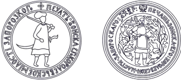
Рис. 3 – Державні печатки Війська Запорозького другої половини XVII ст.

Але головні зміни були попереду: у третій чверті XVII ст. (рис. 3) – зображення списа поруч із козаком, що мало символізувати розташування Низового Війська на військовому кордоні з мусульманським світом [1].