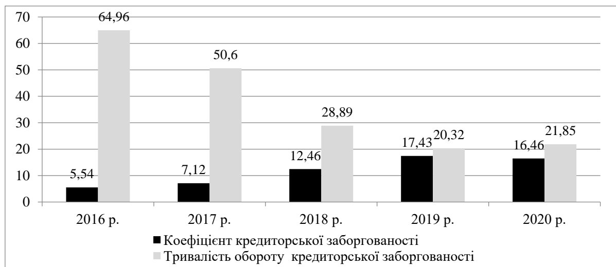
Рис. 3. Аналіз ділової активності ТОВ «Марва» ЛТД за 2016–2020 рр., тис. грн

За 5 років тривалість обороту кредиторської заборгованості знизилась з 65 днів до 21,8 дня, відповідно коефіцієнт оборотності збільшився з 5,54 до 16,46. З точки зору платоспроможності це можна оцінити позитивно, особливо коли немає простроченої кредиторської заборгованості.