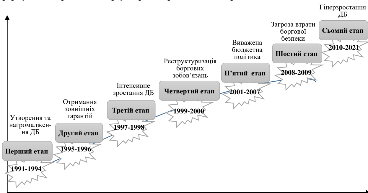
Рис. 1. Етапізація формування державного боргу України за 1991–2020 рр.

Становлення інституту державного боргу з огляду на його нормативно-правове забезпечення зумовлюється складною природою цих відносин, а також предмета та методу правового регулювання. В Україні за роки її незалежності формування боргу відбувалося під впливом потреб оперативного фінансування поточних бюджетних видатків. Етапізація формування державного боргу України представлена на рис. 1.