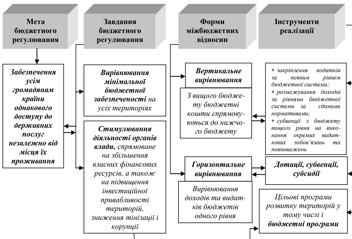
Рис. 2. Механізм бюджетного регулювання та інструменти його реалізації

На сьогодні власними та закріпленими доходами забезпечується більше ніж 52% видатків, а можливість фінансування інших видатків, на думку провідних фахівців, залишається не прогнозованою і залежить від рішення вищих органів влади і перш за все від обсягів наданих трансфертів. Таким чином, на рівні місцевих бюджетів протягом багатьох років є видатки, які недофінансовані від 20 до 80%, або не фінансуються взагалі. Це, перш за все, видатки спеціального фонду бюджету, що пов'язані з фінансуванням капіталовкладень та розвитком територій. Це свідчить про те, що на сучасному етапі на рівні місцевих бюджетів потреба в фінансуванні видатків є, а джерел не існує. Таке явище в бюджетній сфері існує уже більш 20 років, а його назва «прихований» дефіцит місцевих бюджетів. І як наслідок – неефективність використання бюджетних коштів, виникнення утриманських настроїв у місцевих органах влади стосовно ресурсів з бюджету держави, низький рівень розвитку економіки територій, що явно суперечить основним принципам місцевого самоврядування в Україні.