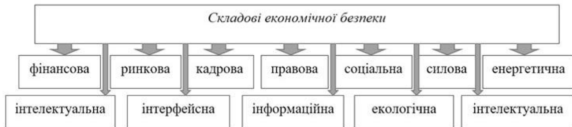
Рис. 2 – Складники економічної безпеки

Економічна безпека підприємства як багатогранне поняття поєднує в собі зовнішні та внутрішні елементи, чим здійснює вплив одночасно на декілька складників економічної безпеки. Варто зазначити, що всі складники економічної безпеки, безперечно, взаємопов'язані між собою, і так чи інакше впливають один на одного (рис. 2):