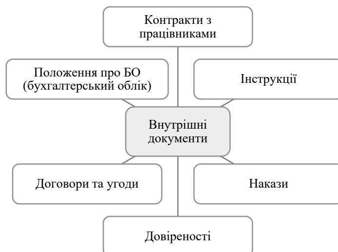
Рис. 2 – Загальні документи аграрних ТОВ

До внутрішньої документації належать загальні та спеціальні документи (рис. 2).