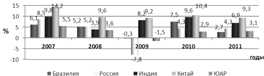
Рис. 1. Темпы роста ВВП в странах группы БРИКС в 2007-2011гг. [6]

В 2011-2012гг. приток инвестиций в Индию был ниже ожидаемого [5]. Можно предположить, что негативная оценка многими специалистами современных показателей индийской экономики является результатом завышенных ожиданий в прошлом.