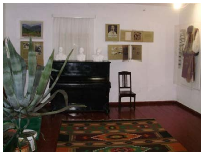
Рис. 3 – Перша кімната музею Коцюбинського

Основна експозиція музею розташована в будинку, де колись проживала родина Коцюбинських, і складається з трьох кімнат. У першій кімнаті (рис. 3) експонуються речі та документи, пов'язані з родиною письменника. Вона розташована в основній залі музею, яка є своєрідною «кімнатою пам'яті». Тут представлені фотографії батьків та інших членів родини, родовідні документи, дитячі речі М. Коцюбинського. У цій залі відвідувачі можуть побачити оригінальні рукописи його творів, фотографії та портрети письменника, різні видання його творів та інші цікаві артефакти, пов'язані з життєвим та творчим шляхом діяча.