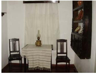
Рис. 5 – Третя кімната музею Коцюбинського

У Вінницькому літературно-меморіальному музеї Михайла Коцюбинського зібрана цікава колекція експонатів, пов'язаних із родиною письменника. Серед них [2]: