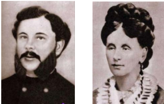
Рис. 1 – Батько і мати М. Коцюбинського

Родина Коцюбинських була відома з кінця XVIII ст. Вона належала до середнього стану і займалася сільськогосподарською діяльністю. Батько Михайла Коцюбинського – Михайло Матвійович – відомий громадський та культурний діяч свого часу. Мати Гликерія Максимівна також була освіченою людиною, здобула художню підготовку та займалася вишиванням (рис. 1).