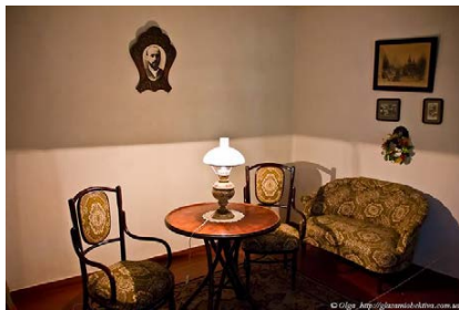
Рис. 4 – Друга кімната музею Коцюбинського

У другій кімнаті (рис. 4) розміщена експозиція, присвячена творчості письменника. Відвідувачі можуть ознайомитися з першими виданнями його творів, листами та фотографіями. Особливу увагу привертає куточок, присвячений роману «Тіні забутих предків», де представлені фотографії знімальної групи фільму та епізоди з фільму.