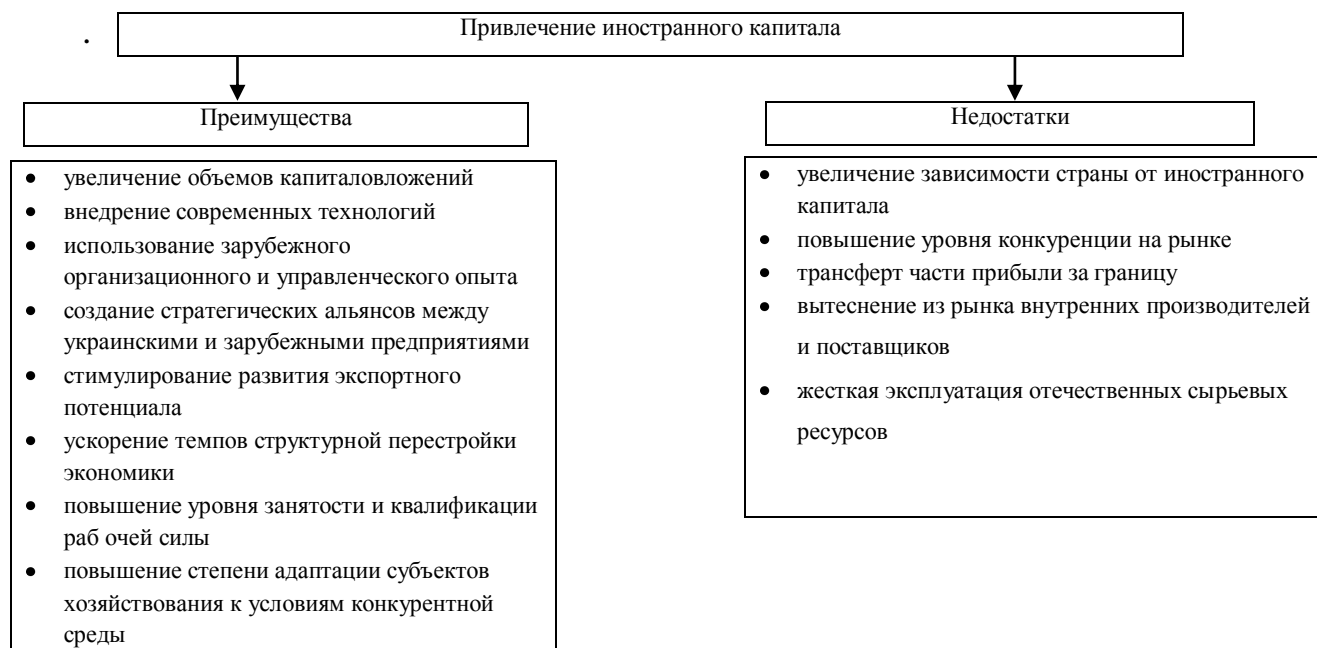
Рис.1. Преимущества и недостатки привлечения иностранного капитала в экономику Украины.

Проведенные исследования особенностей иностранного инвестирования отечественными экономистами показывают, что иностранные инвестиции имеют различные положительные и отрицательные характеристики для экономики Украины, приведенные на рисунке 1.