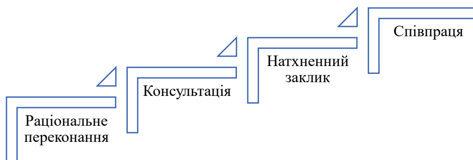
Рис. 2. Успішні тактики лідерського впливу

У процесі виконання функцій лідерства важливо враховувати різноманітні аспекти та прийоми для ефективного лідерського впливу, орієнтовані на конкретну ситуацію.