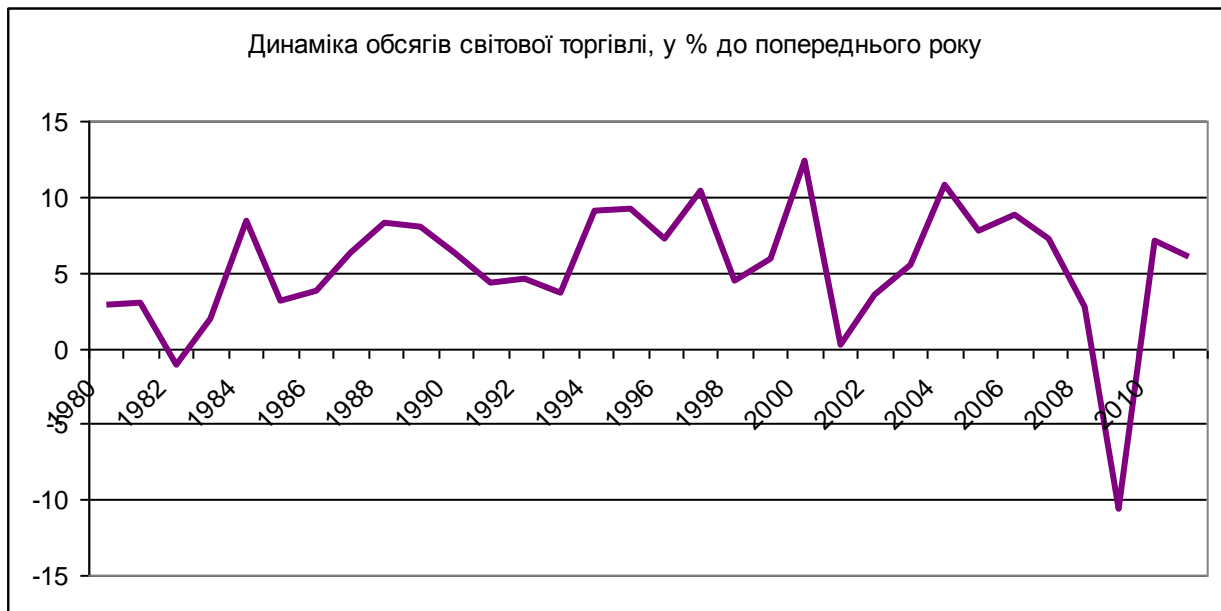
Рис. 2 Динаміка обсягів світової торгівлі, у % до попереднього року [2, с. 78]

Економічна система на сучасному етапі вийшла на докорінно новий рівень взаємодії, коли певні тенденції, як позитивні, так і негативні, набувають загального характеру. Глобальна взаємозалежність була продемонстрована ще у 1998 р. підчас кризи у Тайланді, що мав наслідки далеко за його межами, а саме по всьому азіатському регіоні. Економічна криза, що пролунала у 2008-2010 рр., була набагато більш масштабною та мала вплив на практичну більшість суб'єктів світового господарства, що є найбільш яскравим прикладом поступового посилення економічної взаємозалежності.