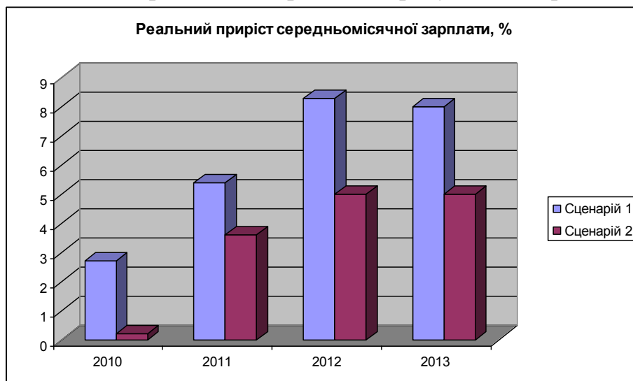
Рис. 2 Реальний приріст середньомісячної зарплати, %

4. Закупівля технічних засобів, створення програмного забезпечення та навчання спеціалістів контролюючих органів із врахуванням прийнятих норм.