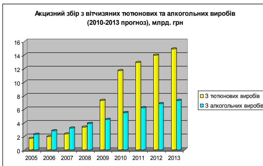
Рис.3 Акцизний збір з вітчизняних тютюнових та алкогольних виробів (2010-2013 прогноз), млрд. грн

Україна перетвориться на зону транзиту контрафактних товарів із країн СНГ до ЄС;