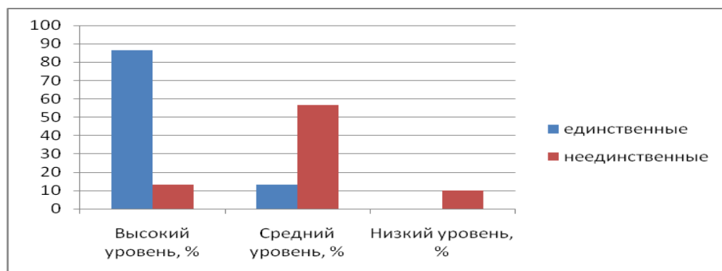
Рис. 2 Распределение испытуемых по уровню самооценки