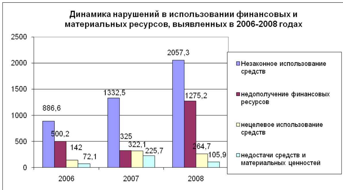
Рисунок 1. Динамика нарушений в использовании финансовых и материальных ресурсов, выявленных Контрольно-ревизионной службой в 2006-2008 годах, (млн грн.) [1].

Проведенные Службой контрольные мероприятия свидетельствуют о том, что и в дальнейшем продолжается негативная практика незаконного и нецелевого использования государственных ресурсов. Такие нарушения финансово-хозяйственной дисциплины в 2006-2009 годах выявлены свыше, чем у половины из проверенных объектов контроля.