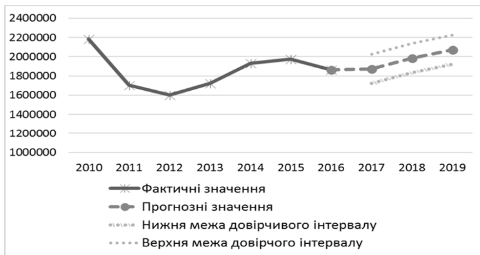
Рис. 3. Динаміка й прогноз кількості СПД в Україні