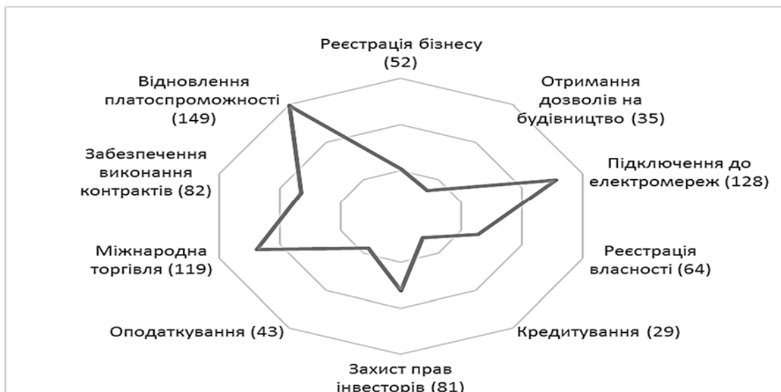
Рис. 1. Позиції України за основними пунктами рейтингу «Doing Business-2018».

На рис. 1 представлено позиції України за основними пунктами рейтингу «Doing Business-2018» [5], з котрого видно, що проблемними питаннями для українського бізнесу є відновлення платоспроможності суб'єктів господарювання (149 позиція), підключення до електромереж (128 позиція), а позитивними пунктами є легка реєстрація бізнесу (52 позиція), отримання дозволів на будівництво (35 позиція) та кредитування (29 позиція).