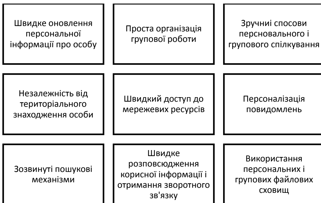
Рисунок 3. Можливості соціальних мереж

На рисунку 3 показані основні можливості, що роблять соціальні мережі такими привабливими щодо використанні у робочому процесі.