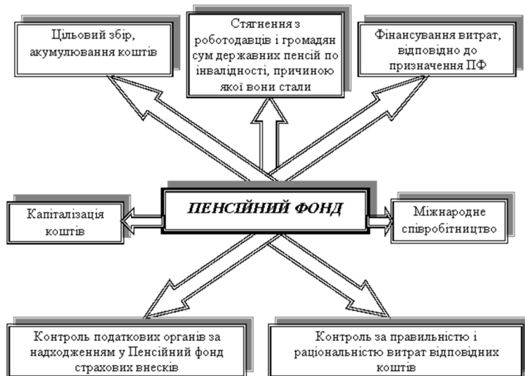
Рисунок 2. Завдання та функції Пенсійного фонду України [7]

Функціональність Пенсійного фонду України: