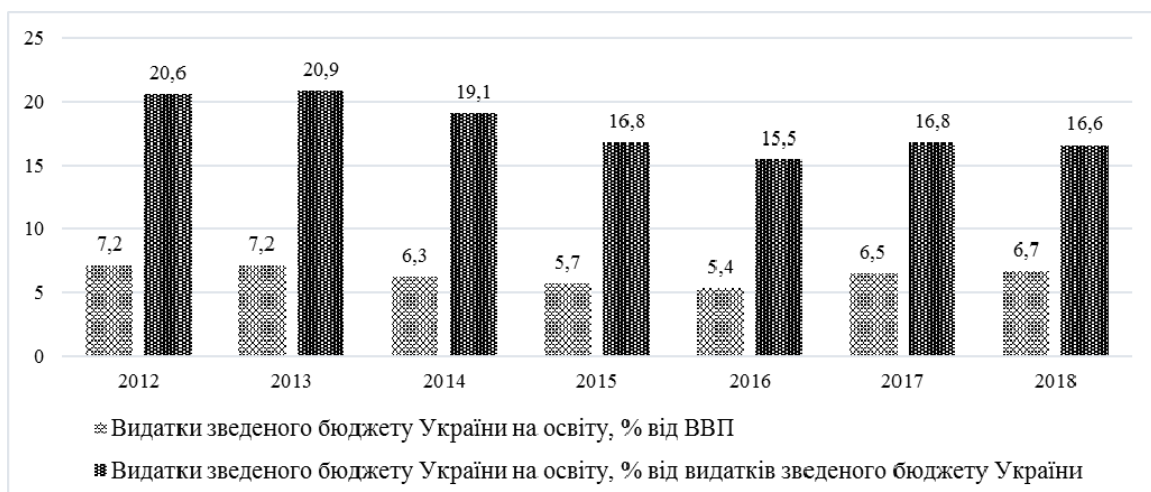
Рисунок 1. Витатки зведеного бюджету України на освіту у 2010–2018 рр.

Як можна бачити з рис. 2, з усієї системи освіти найбільша частка витратків припадає на загальну середню освіту (у 2018 році порівняно з попередніми роками має найбільше значення), значну частину фінансування також займає вища та дошкільна освіта. При цьому основні витатки спрямовані на освітню субвенцію та займають 65–64% [2].