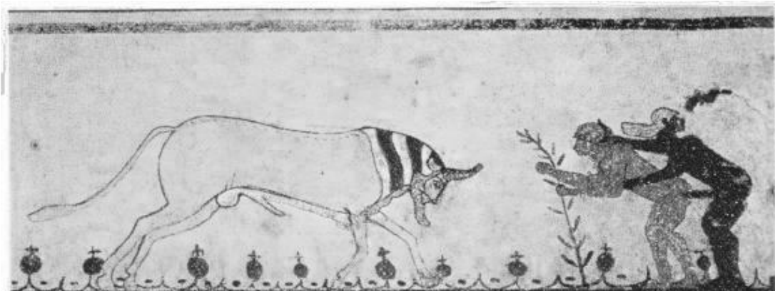
Рис. 2. Гомосексуальне зображення праворуч від арки

Холлоуей, наприклад, відкидає зв'язок цих трьох сцен, наголошуючи, що одна із сцен є гетеросексуальною. Натомість він висуває теорію, що еротичні сцени (як і знайдені фалічні фігурки та зображення) мали апотропічну (оберегову) мету для захисту від «Злого Ока». А роги бика й фалос є саме такими апотропічними інструментами. Щоправда, такі елементи були поширені в прадавні часи, а високий культурний рівень етрусків на момент VI ст. до Р.Х. (з урахуванням їхньої глибокої релігійності) не дозволяє підтвердити цю думку [10].