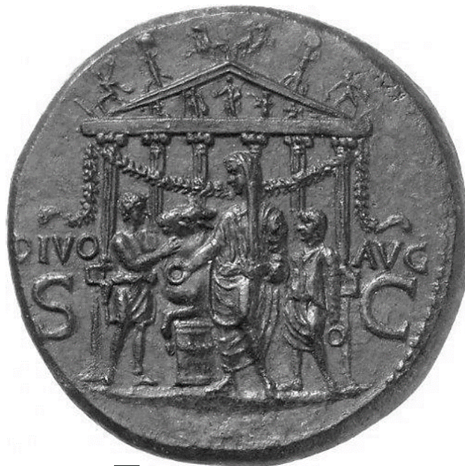
Рис. 3. Калігула присвячує храм Августа (за: [1, с. 69])

Отримавши владу, Калігула продовжував всіляко шанувати сенат, це було характерною рисою в його початковій політиці загалом. Він знайшов навіть підтримки серед населення, на власну честь побудував храми, велів привезти грецьких богів та замінити голови (Зевса в тому числі) на своє зображення. І породив реальний культ не лише самого себе не лише, але й своїх сестер, зокрема Друзілли [8, с. 165–166]. Цей культ ширився всім Римом. Цікаво, що Светоній в момент приходу до влади Калігули згадує, що було би повним довершенням, якщо б він перетворив владу принципату на царську. Треба розуміти, що новому імператору вдалося «приспати» своє оточення, він змінив ряд законів, уведених Тіберієм під час свого владування, так званими «законами надлишків» («Про велич», головним чином). Також зняв заборони з літературної творчості для деяких авторів. І вже того ж 37 року все змінилося. Обставини були такими, що наприкінці року, після своїх напівмір, реформ, які давали римлянам надію, що до влади прийшов не тиран. До речі, «тиран» отримав негативного забарвлення лише за римського часу. Тіберія, якщо в Римі не ненавиділи, то населення розглядало факт зміни влади – позитивним явищем.