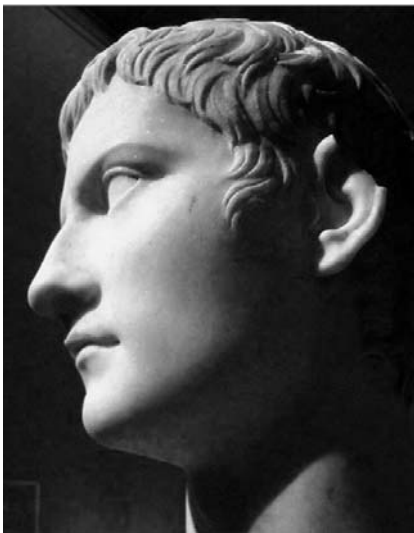
Рис.1. Калігула. Метрополітен-музей (за: [2, с. 73])

Від самого свого дитинства Калігула рушив до влади. В багатьох аспектах у здобутті влади йому допоміг Тіберій, який доводився йому дядьком та прийомним батьком. Тіберій взагалі відіграв значну роль в становленні кар'єри Гая Юлія. Так, він отримав квестуру на п'ять років раніше законного віку, а прямо після неї – консульство, що стало єдиним винятком за всю римську історію [3; 4. 1]. Більше того, він навіть не обіймав посад, які передують консульству – еділа та претора. Нумізматичні джерела все ж таки свідчать, що посаду він отримав пізніше, ніж за 5 років до визначеного законом віку [1; 59. 10]. З одного боку, Тіберій виховав Калігулу, дав йому гарну освіту, з іншого – сам же потурав його не дуже гарним рисам. Маємо підставу казати й про те, що обряд повноліття (ініціації) для Гая Юлія пройшов досить пізно (19 років), до цього моменту він відшукав серйозну прихильність серед армії, втім після наближення до двору жив у постійних інтригах.