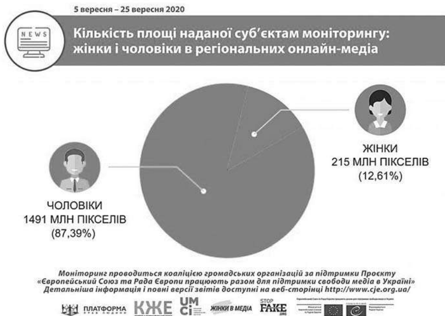
Рис. 2. Кількість площі наданої суб'єктам моніторингу: жінки і чоловіки в регіональних онлайн-медіа [9, с. 167]

Попри зміни на законодавчому рівні, жінки лишаються меншістю в медійній сфері. Аналіз кількості площі [9, с. 167], наданої суб'єктам моніторингу регіональних онлайн-медіа показав нерівномірний розподіл (рисунк 2). Жінки отримали лише 215 млн пікселів або 12,61 %, тоді як чоловіки – 1491 млн пікселів або 87,39 %.